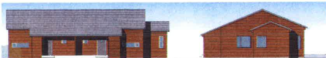
Träpanel – Kupade takpannor